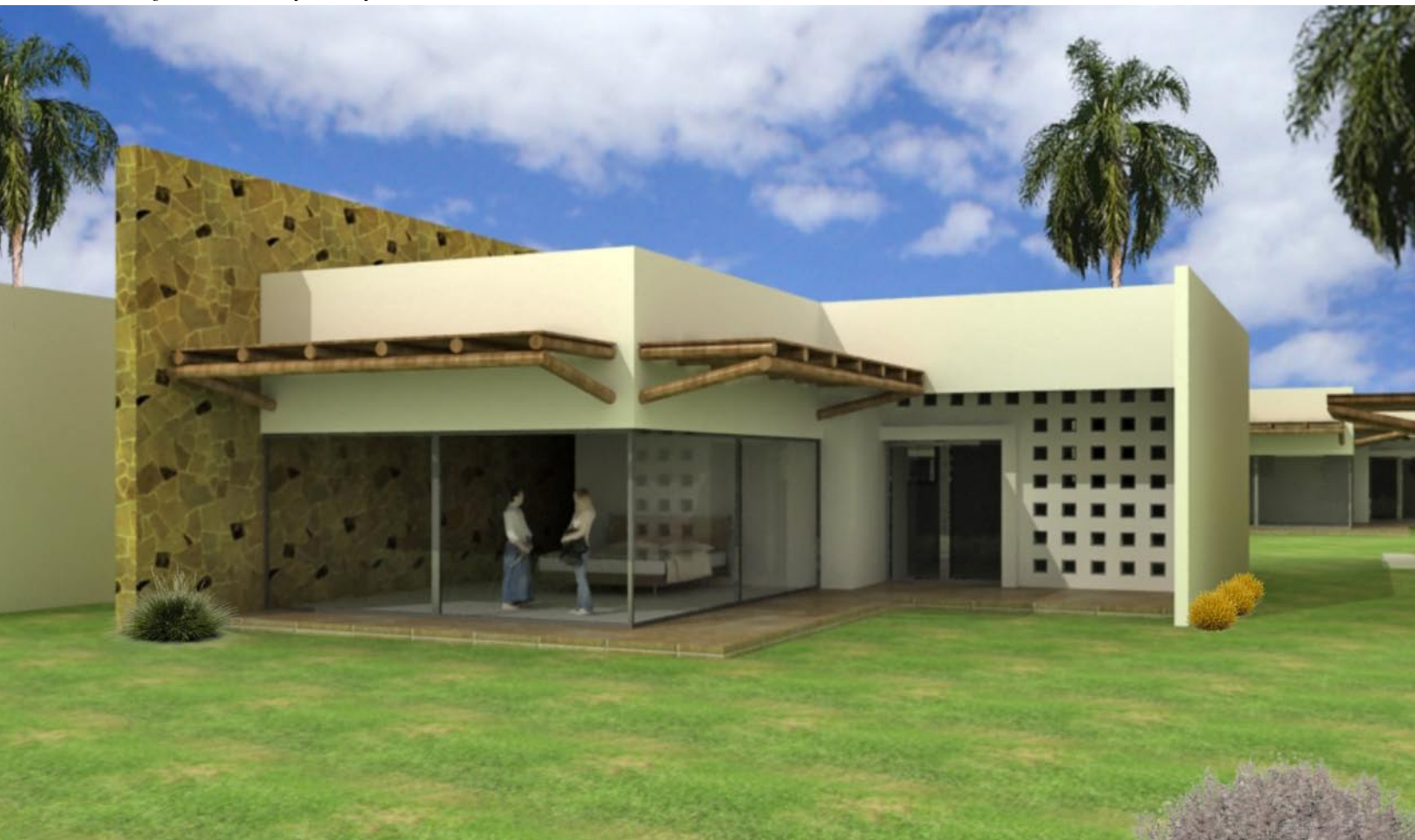
Imagen 4. Vista exterior de apartamento para residentes.