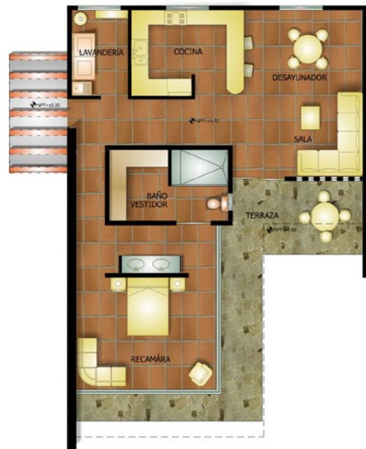
Imagen 3. Plano arquitectónico de apartamento para residentes.