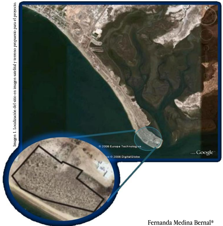
Imagen 1. Localización del sitio en imagen satelital y terreno propuesto para el proyecto.

Fernanda Medina Bernal* Beatriz Elías Laborín**